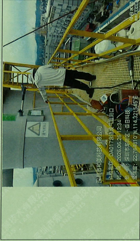
DA017 5号铬酸雾废气监测口 (1*◎)