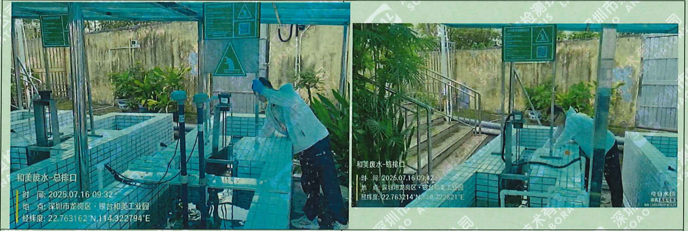
DW003 工业废水总排口 (1#★)