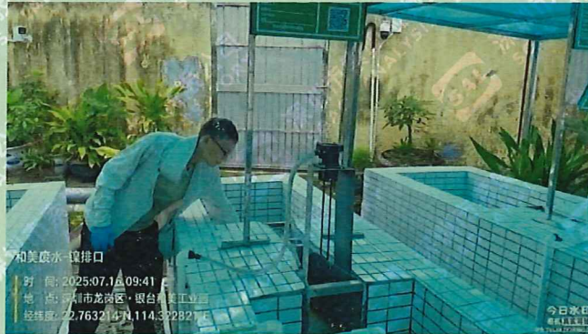
DW001 含镍一类排放口 (3#★)